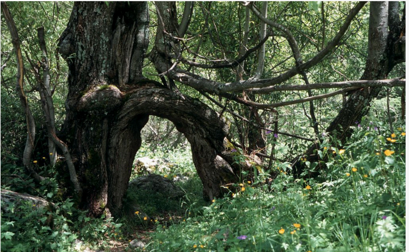
Arbre remarquable dans le vallon du Tourond