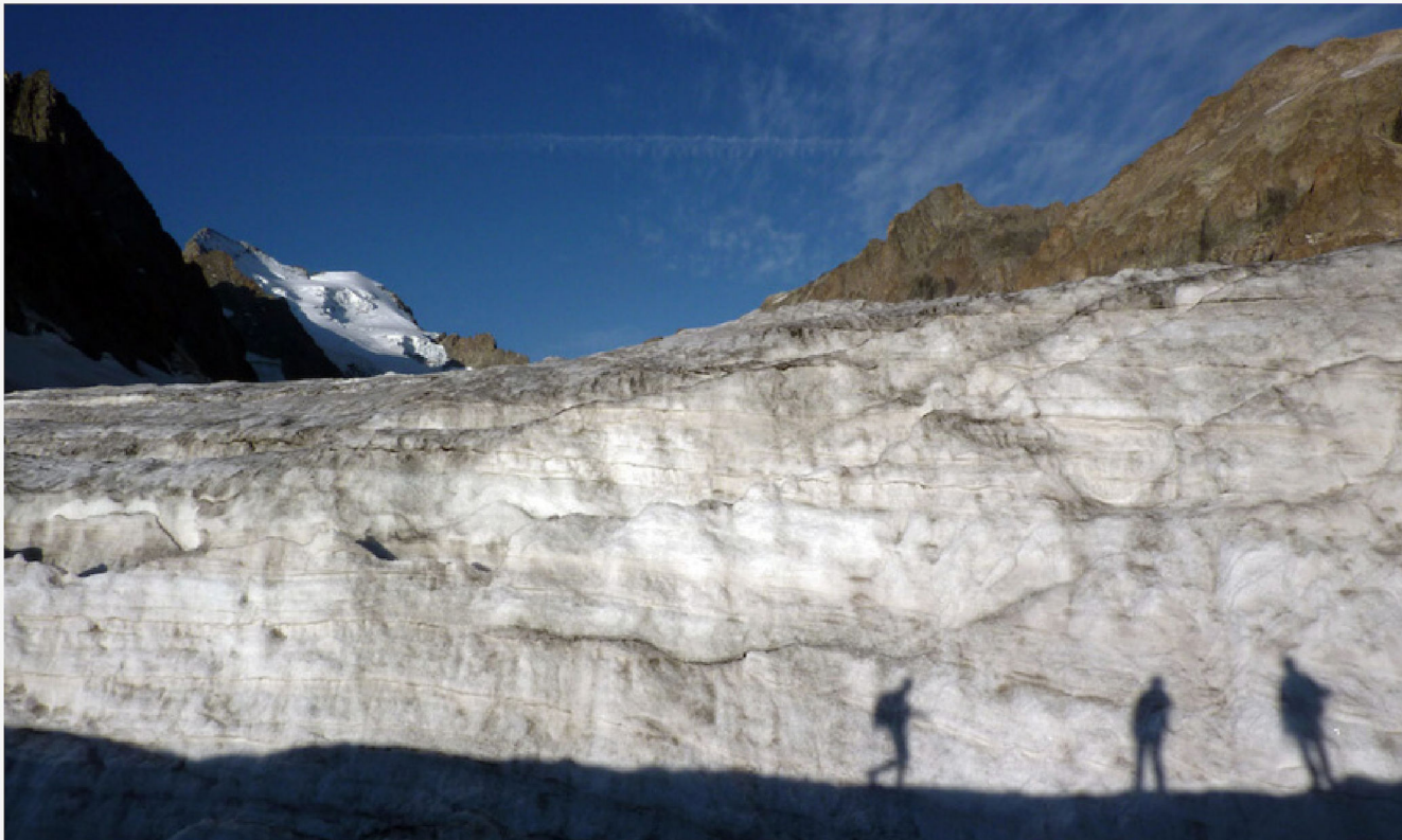
Glacier blanc, la barre et le dome des Ecrins en arrière plan