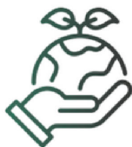
Lien au vivant

Les actions de Cultures Eco Actives sont l'occasion de partager des expériences et des savoirs-faire spécifiques au plus grand nombre.