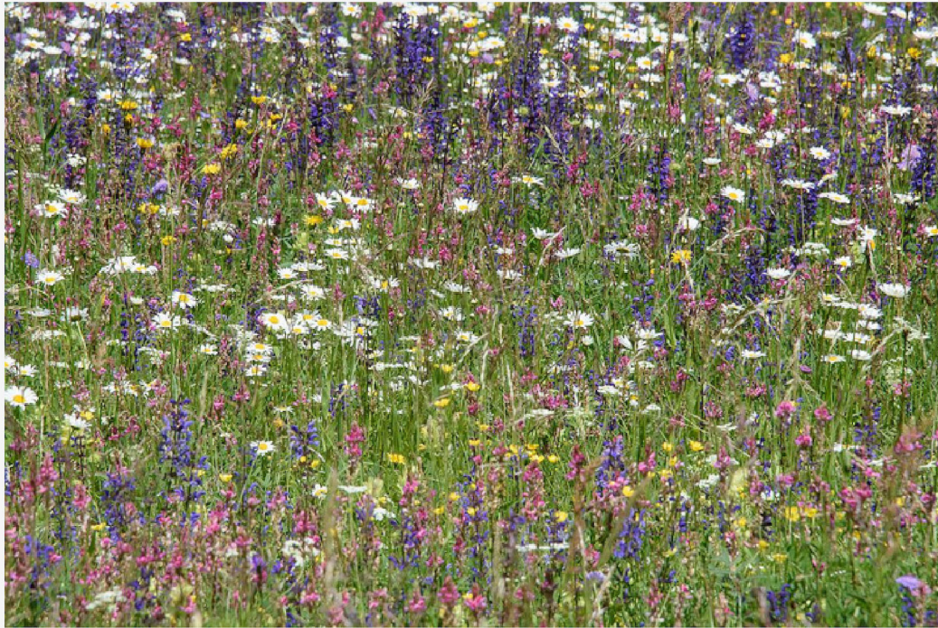
Prairie fleurie à Réallon - Mireille Coulon - Parc national des Ecrins