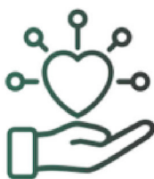
Art et soin à l'environnement